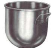
detalhe da cuba

Argamassadeira Planetária para homogeneização e preparo de amostras. Possui três velocidades, cuba com capacidade de 20 litros e batedor planetário tipo raquete, ambos contruídos em aço inox. Alimentação 220V/380 - Trifásico - 60Hz - Conforme norma: NBR 13320